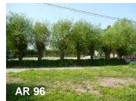
N°17: Saule blanc - Salix alba

Les frênes pleureurs sont toujours greffés. Ils peuvent atteindre 17 mètres. Leurs rameaux droits pendent vers le sol.