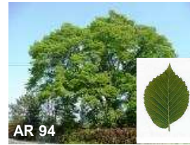
N°12: Orme hybride de Hollande - Ulmus X hollandica

Un champignon attaque l'orme, l' Ophiostoma ulmi transmis par des insectes (les scolytes) ou par contact racinaire. Cette maladie s'appelle la Graphiose. Il n'y a pas de remède et il est conseillé d'abattre l'orme malade pour qu'il n'en contamine pas d'autres.