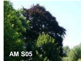
N°14: Hêtre pourpre - Fagus sylvatica 'purpurea'

Le terme 'openfield' désigne un paysage de champs ouvert, typique de la région Hesbignonne.