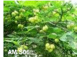
N°15: Faux pistachier - Staphylea pinnata

Les plus beaux hêtres pourpres sont greffés. Les hêtres sont attaqués par un insecte ( Taphrorychus bicolor ), qui s'introduit sous son écorce et provoque le dépérissement de l'arbre.