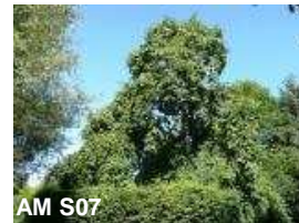
N°16: Frêne pleureur - Fraxinus excelsior 'Pendula'

Seul représentant européen d'une famille de 24 espèces originaires des régions tempérées de l'hémisphère Nord. Petit arbre pouvant atteindre 6m. Appelé aussi "nez coupé". Fleurit en avril-mai en grappes de fleurs blanches de 5 à 12cm. Le fruit contient 1 à 2 grosses graines jaunâtres.