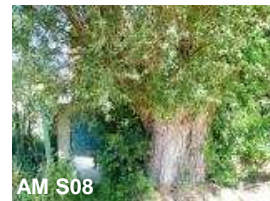
N°18: Saule blanc - Salix alba

Au coin, rue du Try al Vigne. 18 sujets têtards. Très bel