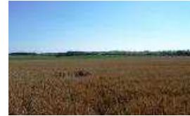
N°13: En chemin, très beau paysage - 'Openfield'

Un champignon attaque l'orme, l' Ophiostoma ulmi transmis par des insectes (les scolytes) ou par contact racinaire. Cette maladie s'appelle la Graphiose. Il n'y a pas de remède et il est conseillé d'abattre l'orme malade pour qu'il n'en contamine pas d'autres.